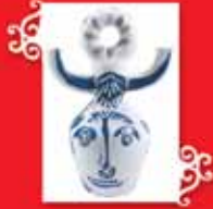
BOĞA BAŞLARI Vallauris, 1950-51 Seramik, 51x37 cm Özel koleksiyon © Succession Picasso 2005.