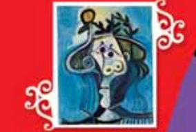
KADIN Mougins, 7 Temmuz 1971 Tuval üzerine yağlı boya, 81x65 cm Özel koleksiyon © Images Modernes, Foto: Marc Damage © Succession Picasso 2005.