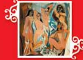
AĞIGNON'LU KIZLAR Özgün tablo: 1957, Dokuma: 1958 Yün, 222x260 cm Özel koleksiyon © Images Modernes, Foto: Marc Damage © Succession Picasso 2005.