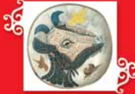
KEÇİ BAŞI Vallauris, 1952-53 Seramik, 40x40 cm Özel koleksiyon © Succession Picasso 2005.