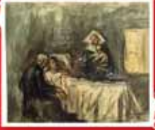
BİLİM VE MERHMET İÇİN ETÜT Barcelonà, Kış-İlkbahar 1897 Kağıt üzerine sulu boya, 22,8x28,4 cm Museu Picasso, Barcelonà, env. 110.089