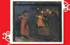
DANS SALONUNUN DIŞINDAKİ KADIN Barcelonà, 1899 Tuval üzerine yağlı boya, 46x55 cm Fundación Almine y Bernard Ruiz-Picasso para el Arte © Fundación Almine y Bernard Ruiz-Picasso para el Arte © Succession Picasso 2005.