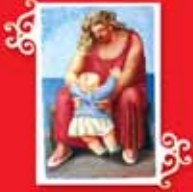
ANNE İLE ÇOCUK Paris, Sonbahar 1921 Ahşap üzerine yağlı boya, 14,5x9,5 cm Özel koleksiyon © Succession Picasso 2005.