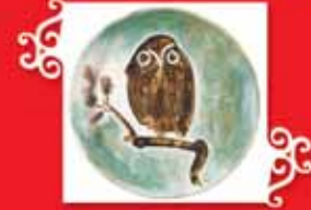
DALDAKİ BAYKUS Vallauris, 1967 Seramik, çap: 38 cm Özel koleksiyon © Succession Picasso 2005.