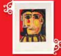
KADIN BAŞI NO 5, DORA MAAR PORTRESİ Paris, Ocak-Haziran 1939 Renkli gravür, 29,9x23,7 cm Özel koleksiyon © Succession Picasso 2005.