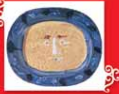
YÜZ Vallauris, 11 Ekim 1947 Seramik, 32x38 cm Özel koleksiyon © Succession Picasso 2005.