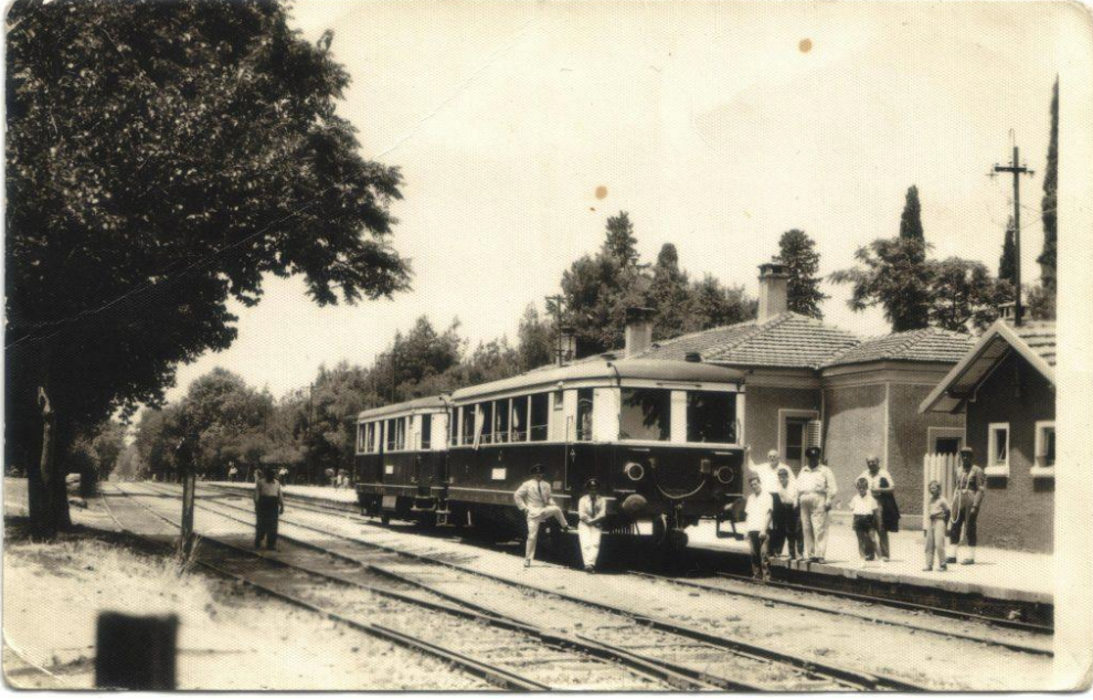
1960 . Bornova Tren İstasyonu.