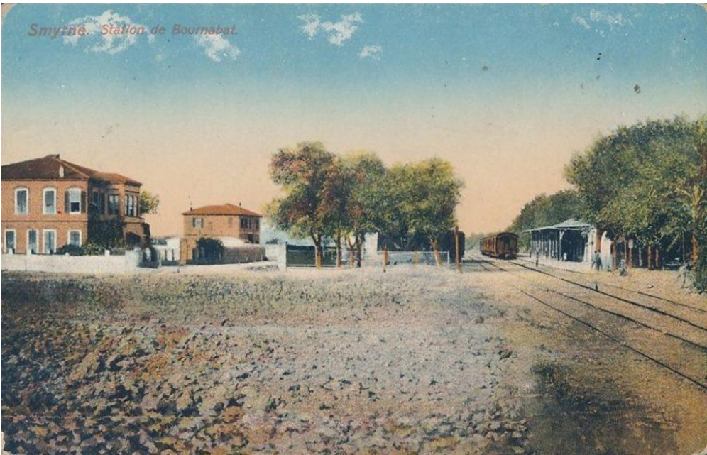
20 yy. başları. Bornova Tren İstasyonu