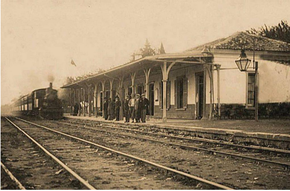
1940'lı yıllar Bornova Tren İstasyonu