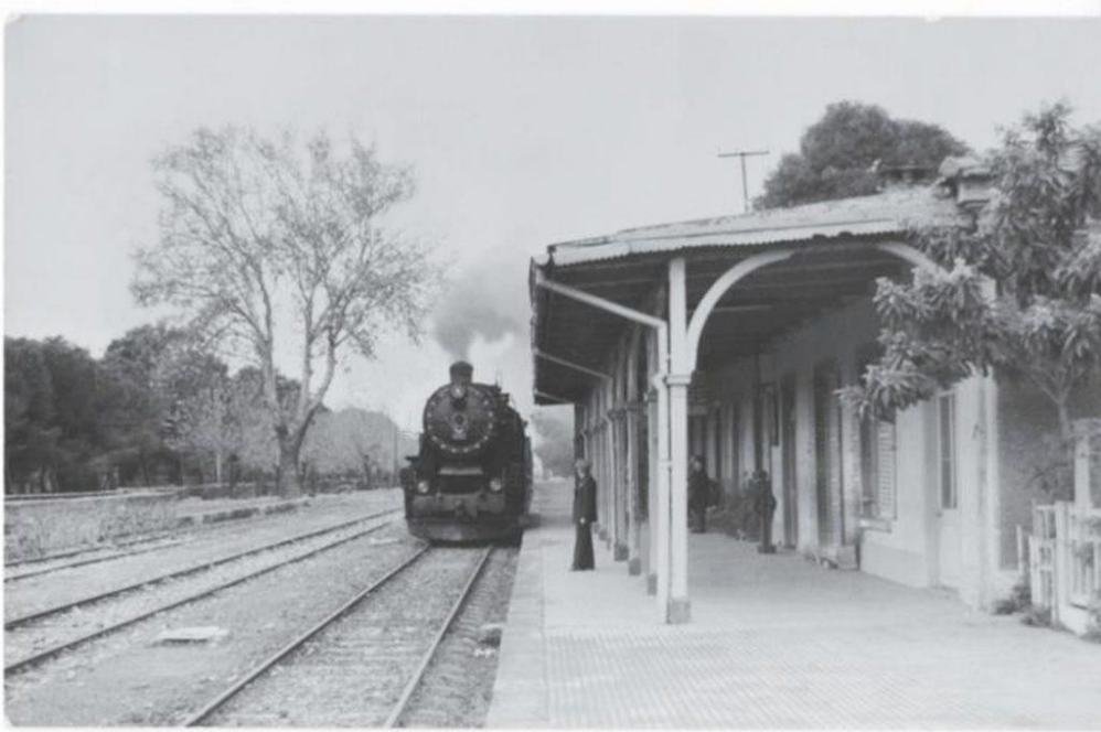
1960'lı yıllar. Bornova Tren İstasyonu