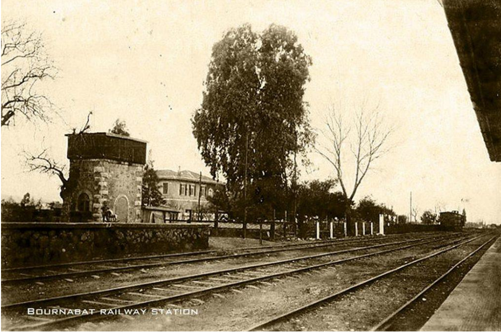
20 yy başlarında Bornova Tren istasyonu