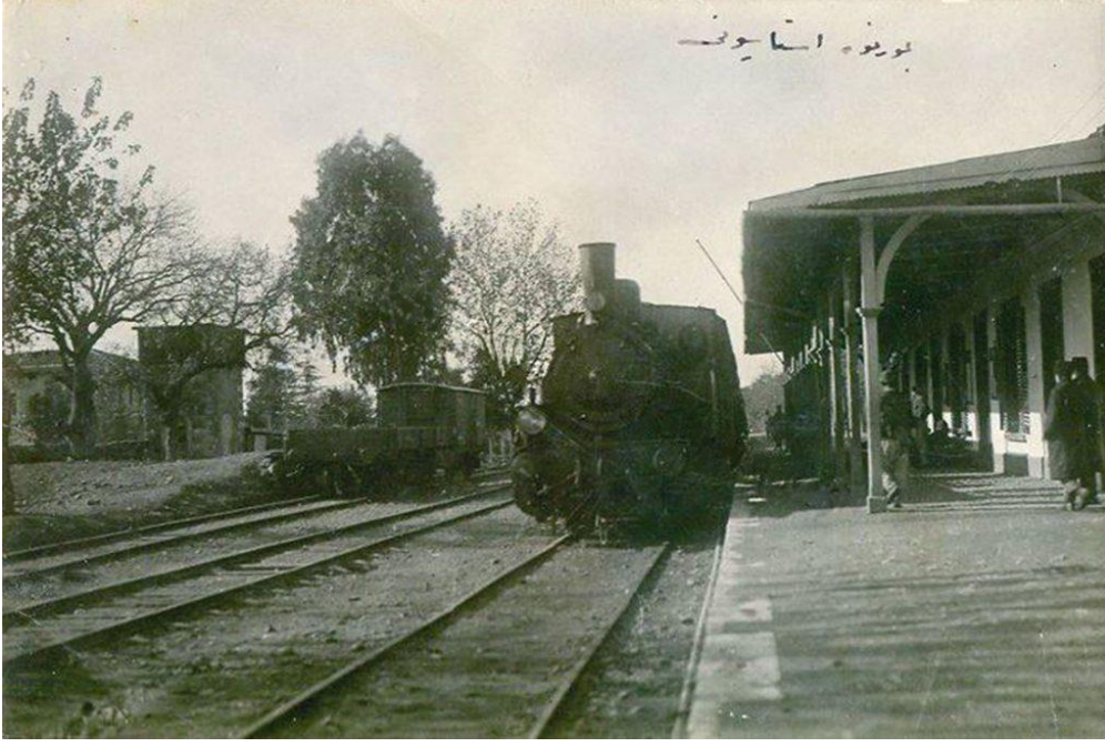
1920'li yıllar... Bornova Tren İstasyonu