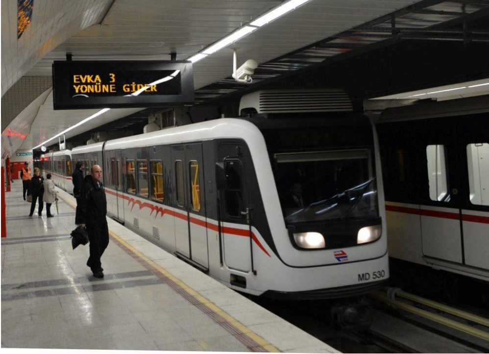
Günümüzün Bornova'sında raylı sistem