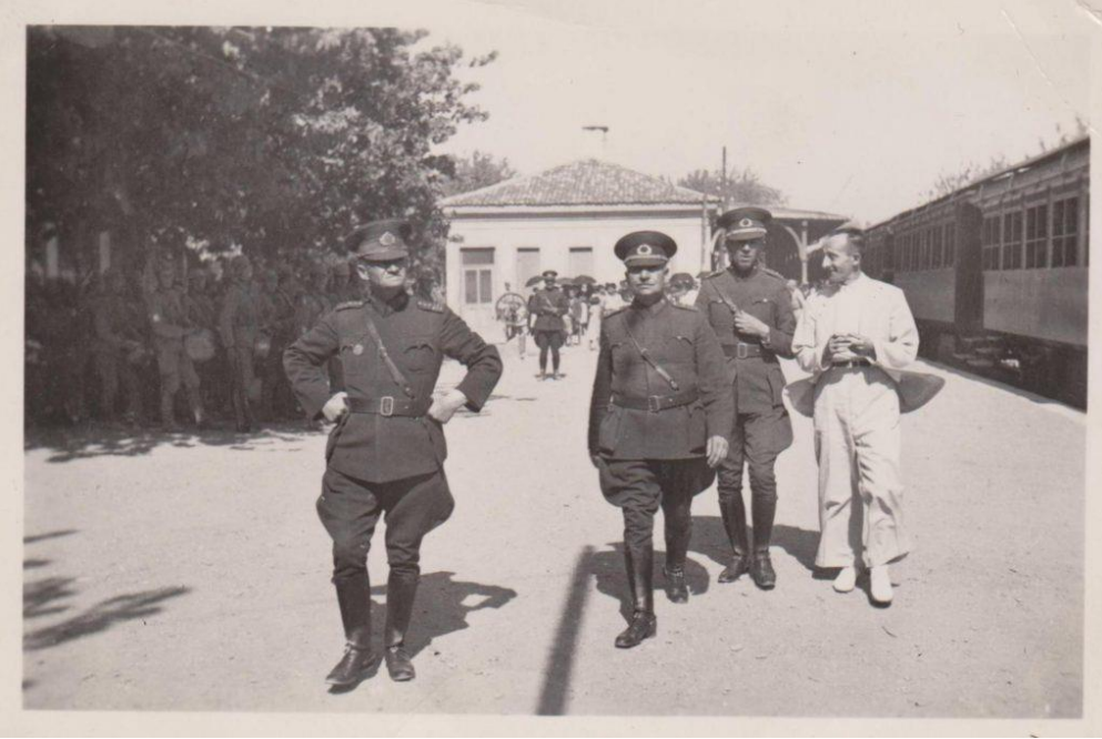
1937 yılı. Bornova Tren İstasyonu'n da asker sevkiyatı