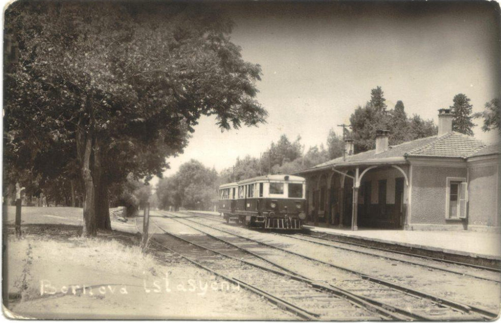
1960 Bornova Tren İstasyonu