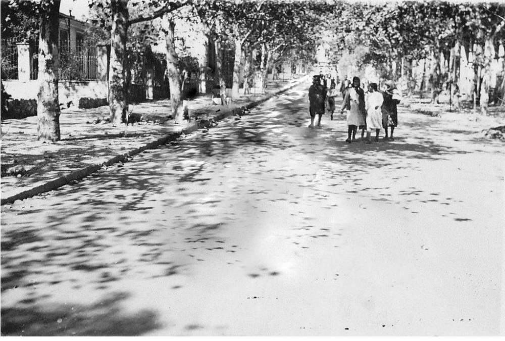
Sabahları işyerlerine yetişmek için Mahfelden Bornova Tren İstasyonu'na doğru aceleyle yetişmeye çalışan kadınlar.