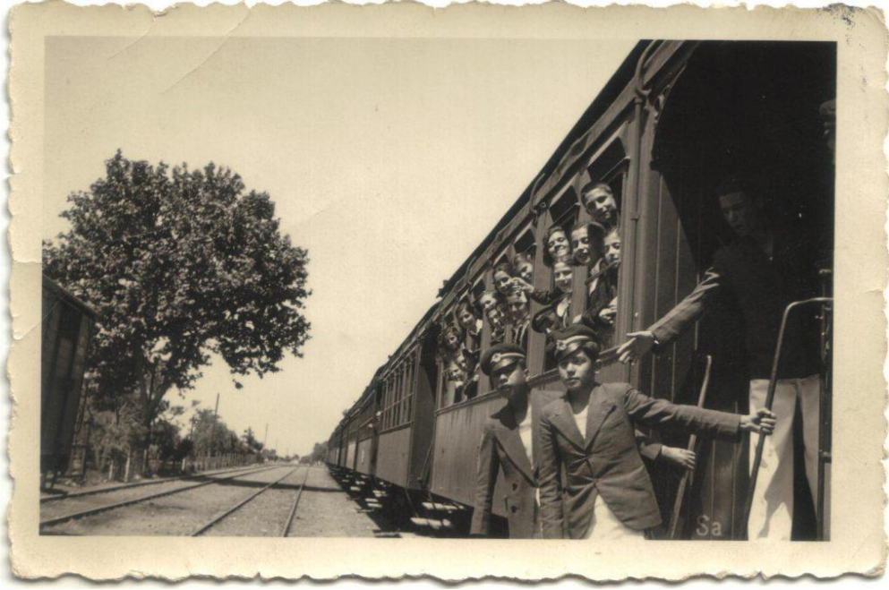
1937 Bornova Ortaokulu Öğrencileri bir gezi sırasında Bornova Treni'nde